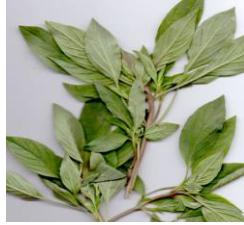
Rau quế / Basilikum