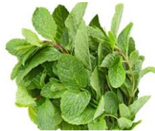
Bac Ha / Minze