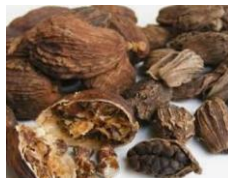
Thao Qua / Kardamom