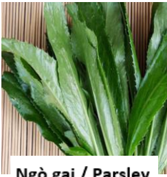
Ngò gai / Parsley