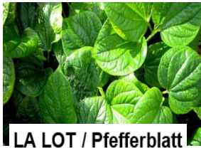
LA LOT / Pfefferblatt