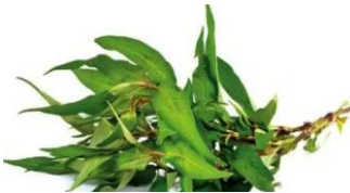
Rau Ram / Vietnam. Koriander