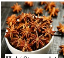
Hoi / Sternanist