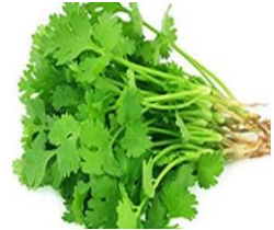
Ngò rí / Koriander