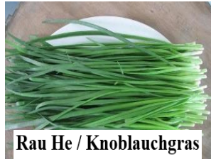
Rau He / Knoblauchgras