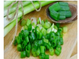
Hanh La / Lauchzwiebel