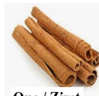
Que / Zimt