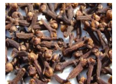
Glove / Gewürznelken