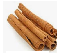
Que / Zimt