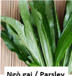
Ngò gai / Parsley