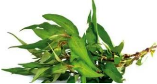
Rau Ram / Vietnam. Koriander