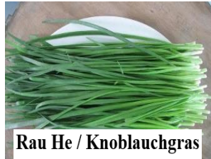
Rau He / Knoblauchgras