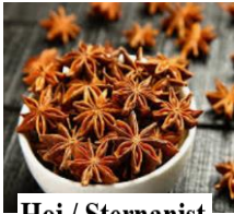
Hoi / Sternanist